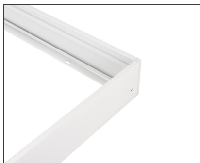
032970 Набор SX6060T White

Белая рамка для накладной установки панелей