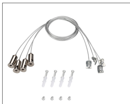
029583(1) Набор SPX-T4 для панелей 600x600

Белая рамка для накладной установки панелей