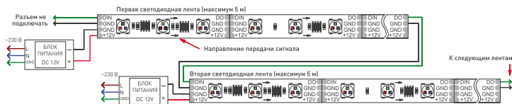
Рис. 1. Схема подключения ленты без использования внешнего контроллера (максимум 1024 пикселя, общий рисунок динамического эффекта при переходе с ленты на ленту сохраняется)