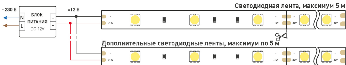
Схема 1. Подключение нескольких светодиодных лент с одной стороны.

Максимальная длина подключения ленты – 5 м (1 катушка).