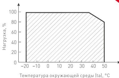
Рис. 3. Максимальная допустимая нагрузка, % от мощности источника