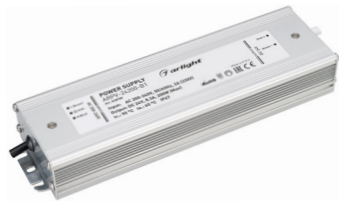
ARPV-12200-B1 ARPV-24200-B1 ARPV-24300-B1