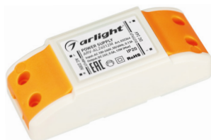
ARV-AL120x ARV-AL240x ARV-120x ARV-240x